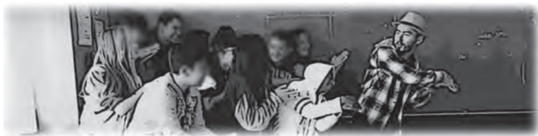
Figura 2 – O coro de movimento