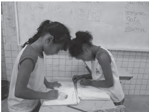
Figura 3 – Realização do desenho observando características do “outro”