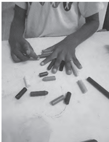
Figura 5 – Comparação das cores de lápis com a pele

Diante desse impasse, propusemos outra atividade com utilização de lápis de cor e giz de cera, fazendo deles o mesmo que se fez antes com os objetos. Assim, diante do espelho, o aluno comparava a cor de variados lápis e giz com a cor da própria pele, analisando as suas mãos, o seu rosto, seus olhos e cabelos.