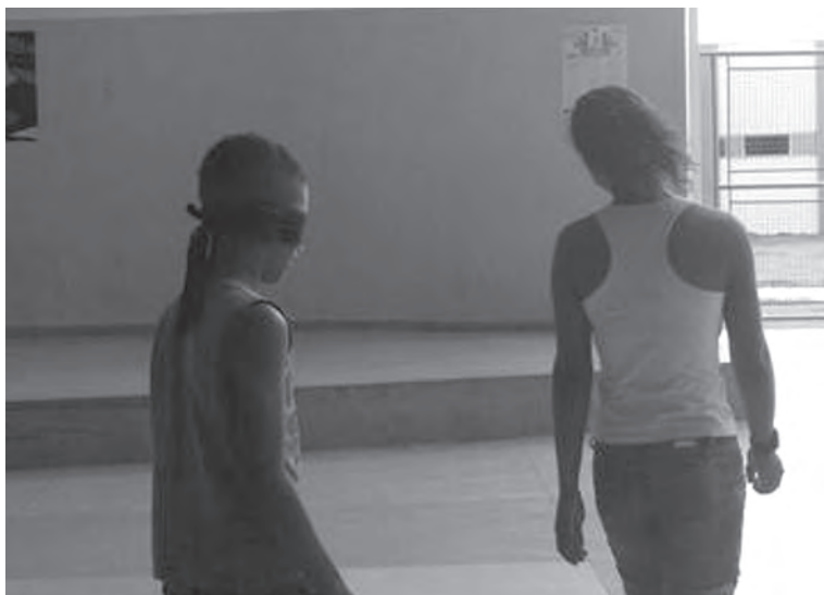
Figura 1 – Jogo condução às cegas