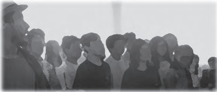
Figura 1 – O Corpo-Cardume

Dessa maneira natural como Angel Vianna enxerga a poesia que existe no corpo, aula após aula, mesmo em meio às limitações que o cotidiano e os aspectos formais impõem, percebi que ambos os “cardumes”, o 9º C e o 9º D, assumiam para si novas possibilidades dentro daquele espaço reduzido, o “AQUÁRIO”, ao ampliar seus repertórios e gerar ali uma nova percepção da sala de aula, transformando as experiências vividas em repertório corporal e ampliando o conhecimento dentro de cada linguagem (dança e teatro). Muitas vezes conseguimos alcançar um nível de entrega e acreditar no exercício, mas nem sempre isso era possível devido a interferências sonoras, como o sinal, interrupções para recados pela direção ou equipe pedagógica, conversas paralelas daqueles que não estavam “na cena” e outros fatores externos que fogem do nosso controle como professor.