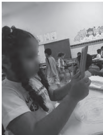
Figura 6 – Menina observando rosto no espelho